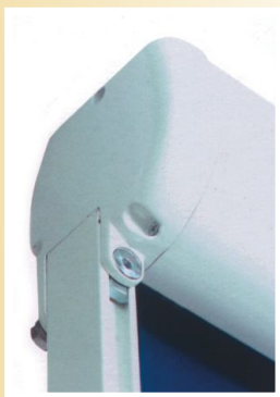
boční kryt stropní kazety