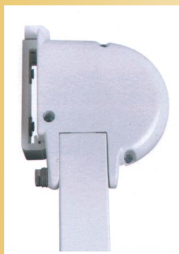
boční kryt stěnové kazety