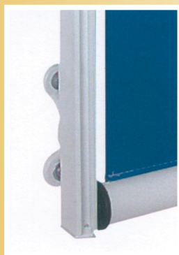
hliníkový vodící profil