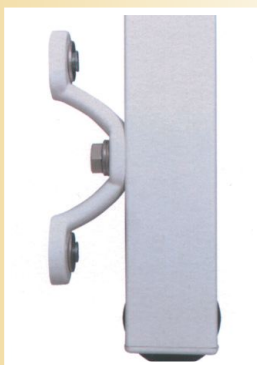
vodící profil s montážní konzolou